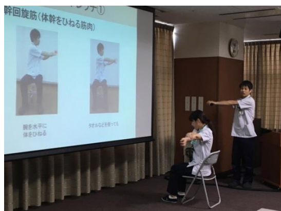
理学療法士、作業療法士によるストレッチのレクチャー

患者様・ご家族からいただいた貴重なご意見は今後の運営に反映させていただきます。次回は、平成 31 年 1 月 19 日（土）に「漢方（タイトル未定）」をテーマにがん患者サロンを開催予定です。