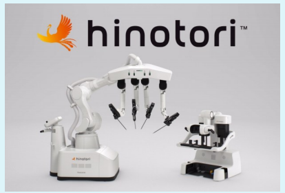
手術支援ロボット hinotori

当センターでは、ロボット支援手術を行う診療科(泌尿器科・婦人科・消化器外科)の医師に加え、麻酔科、看護師、臨床工学技士等の手術スタッフが、診療科や部門を超えた横断的なチームで手術にあたります。質の高い安全管理や効率的な手術運用ができるよう情報を共有し、より安全で精度の高い手術をご提供できるよう尽力しています。